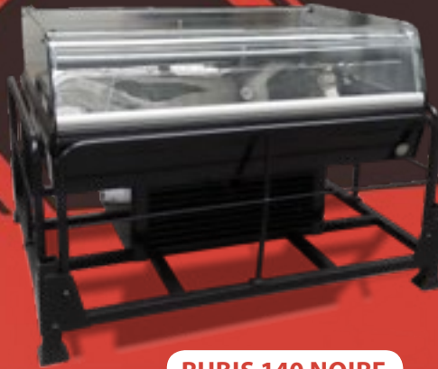
RUBIS 140 NOIRE