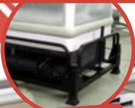
Panoramique sur Rack

Bi-température : 0°C +8°C ou -18°C -25°C (par +25°C d'ambiance)