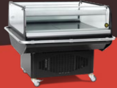
RUBIS 111 NOIRE